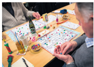
Overskuddet fra andespillet går til www.langeland-midt.dk.