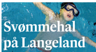
Svømmehal på Langeland

Kommunen har sikret fondsmidler til svømmehal og vil bruge det som argument i forhandling med minister om øget lånedisposition